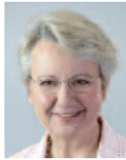
Prof. Dr. Annette Schavan Bundesministerin für Bildung und Forschung, Berlin

18:00 - 19:30 Eröffnung Mikrosystemtechnik Kongress 2011