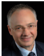
Horst Westerfeld Staatssekretär im Hessischen Ministerium der Finanzen sowie Bevollmächtigter der Hessischen Landesregierung für E-Government und Informationstechnologie, Wiesbaden